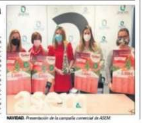
NAVIDAD. Presentación de la campaña comercial de ASEM.

Molina destacó la alta participación de empresas en esta edición superando las 200, además señaló que "Desde ASEM hemos realizado un esfuerzo económico importante manteniendo la cuantía de los premios en metálico que se sortearán a través de las paperas que se repartirán en las empresas participantes, igual que en años anteriores en 300€ repartidos en un cheque de 200€, dos de 100€ y dos de 50€". Además se van a repartir entre las empresas un poco con luz, para que además los escaparates contribuyendo con ello a dar más iluminación a las calles de Martos.