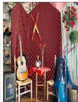
FIESTA. Uno de los comercios preparados para la ocasión

coojigan más "me gusta" en las fotos que irán subiendo en sus redes sociales. Los comerciantes de la Ciudad de la Peña adoman sus escaparates con trajes de gitana, batas de cola, mantillas, guitarras y recuerdan a sus paisanos, una vez más, que están ahí, pebando por Martos, luchando por la ciudad, poniendo alegría a las calles a través de sus escaparates, para hacer llegar un mensaje a la ciudadanía de que no hace falta ir más lejos para etener sus compras. Hoy el ferrial está vacío, pero los comercios de Martos están limos de vida esperando a que hagan sus compras.