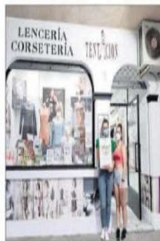
COMERCIO. Dependienta de la tienda Lencería Testjóns.

Desde ASEM le propusieron a los comercios la idea de hacer un "camino solidario", de tal manera que en cualquier calle, en el mayor número de establecimientos los martosinos tuviesen acceso a los boletos. Una vez más los comerciantes martosinos demostraron su solidaridad, sumándose de manera altruista a exponer en el lugar más visible de su establecimiento los carteles identificativos y los boletos, que bajo el lema "Hazte fan de las personas que hacen que las cosas cambien", puso en marcha la Cruz Roja, con motivo de su tradicional Sorteo del Oro.