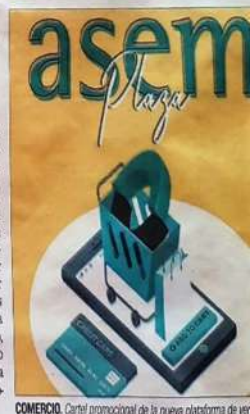
COMERCIO. Cartel promocional de la nueva plataforma de venta online.

arumca a través de la página web asemplaza.es. Una vez dentro, el comprador puede acceder a todos los productos de las empresas, luego selecciona el que le guste y, así, realizar su compra, que en un plazo de 24 horas recibirá en casa. Durante la campaña del Día de la Madre, la plataforma está sirviendo de ensayo real para poder ver su evolución, modificar o ampliar las secciones, aceptar sugerencias de los usuarios para que poco a poco vaya mejorando y, sobre todo, posicionándose en el mercado hasta que el comprador conozca de primera mano la gran oferta comercial que hay en la ciudad.