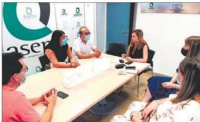
REUNIÓN. Miembros de las juntas directivas de Cruz Roja y la Asociación Empresarial Martesña, en el encuentro.

Una de las principales acciones será el crear en la página web de ASEM un servicio para las empresas asociadas para la formación específica de trabajadores, en función de las necesidades de cada una, para la inserción laboral de los usuarios de Cruz Roja. Además, se pedirá la colaboración de las empresas y comercios de la ciudad para hacer un gran camino solidario en la venta de boletos del sorteo del oro de Cruz Roja, que se desarrollará entre el 21 de septiembre y el 26 de noviembre, y así poder obtener fondos para poder continuar con la enorme labor solidaria que desarrollan.