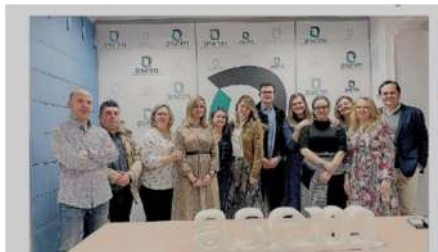
EUROPA. Foto de archivo de la junta directiva de la Asociación Empresarial Marteña.