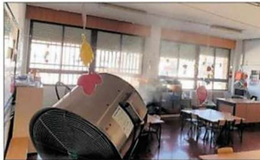
TRABAJO. Un equipo pulverizador realiza el tratamiento de desinfección en un aula escolar.

La empresa fue requerida por los colegios Taccó, San Amador, Divina Pastora y San Antonio, donde se procedió a la desinfección de todas las aulas. Este tratamiento se realiza con un equipo pulverizador fabricado en acero inoxidable mediante el sistema de pulverización de microgotas. Además, tiene un efecto rápido de evaporación, permitiendo utilizar nuevamente la estancia en un corto espacio de tiempo, y no daña ni mancha las superficies tratadas. Una vez finalizado el proceso de saneamiento se debe proceder a un intenso lavado de las aulas.