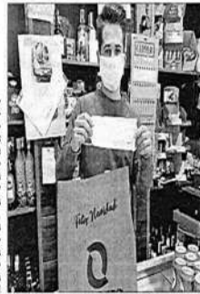
COMERCIO. Operativo de reparto de boxes con ASEM

tales a cuantos permitiera las necesidades. La Guardia Civil acompañó al personal de ASEM, para facilitar el reparto en las empresas asociadas: 34 boxes con ASEM, en la calle Carrera 94, Puente de Acorchales, en la zona de San Amador 18 y Pastelería Urdía, en Argenta, Carrera Tuziñana 22.