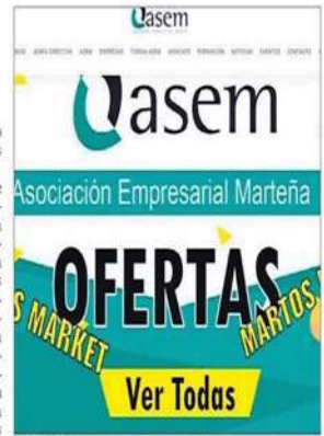
COMERCIO. Portada de la página web de ASEM.

La junta directiva mantiene contacto permanente con el Ayuntamiento sobre la evolución de la crisis sanitaria y propuso la ejecución de tasas de ocupación de vía pública para vialidades y terrazas en el sector de la hostelería, medida que aprobó el equipo de Gobierno. También se propuso una condonación de algunos impuestos y tasas municipales, como basura y contribución, que también fuer aceptada y que se encuentra en estudio para ser aplicada tras el periodo de crisis.