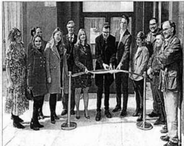
COMERCIO. Representantes de ASEM y políticos, durante la inauguración de la muestra, en los Salones Morys.

Además, la cita se celebra en los Salones Morys, hasta hoy que es su escenario, que hacen el escenario ideal para el desarrollo de una muestra que pretende la promoción del comercio artesano y que los visitantes hagan sus compras en la ciudad Martesña, porque como nos su colega "Martos, no hay que ir más lejos". Una feria en la que los visitantes podrán encontrar todo lo necesario para el perfecto desarrollo de su evento, desde trajes para niñas e invita-