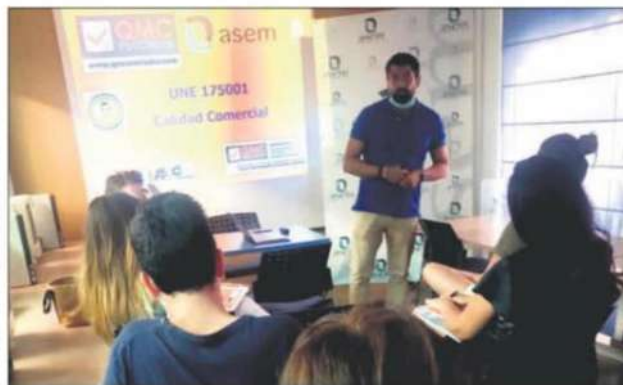
COMERCIO. Participantes del curso de formación en la sede de ASEM.

Por otro lado, la Asociación Empresarial Martefa está inmersa en una campaña para incentivar y fomentar el comercio local tras la crisis por la pandemia, en colaboración el Ayuntamiento. Se trata de una campaña de verano en la que participan más de 200 negocios y se busca fomentar las compras en los establecimientos participantes repartiendo a cada persona que adquiera algún producto o servicio en ellos, por un valor superior a los 20 euros, un ticket que les permitirá participar en un sorteo para ganar uno de los tres cofres VIP que ofrecen, incluyendo cada cofre un viaje.