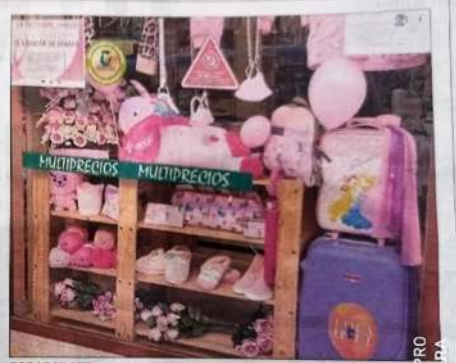
ESCAPARATE. La tienda de Multiprecios participó en la campaña.