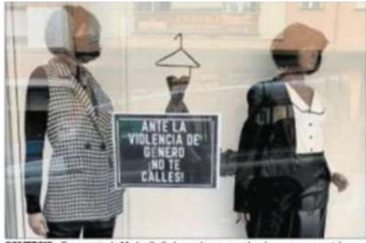
COMERCIO. escaparate de Modas Ibell, decorado con prendas de negro y un cartel.